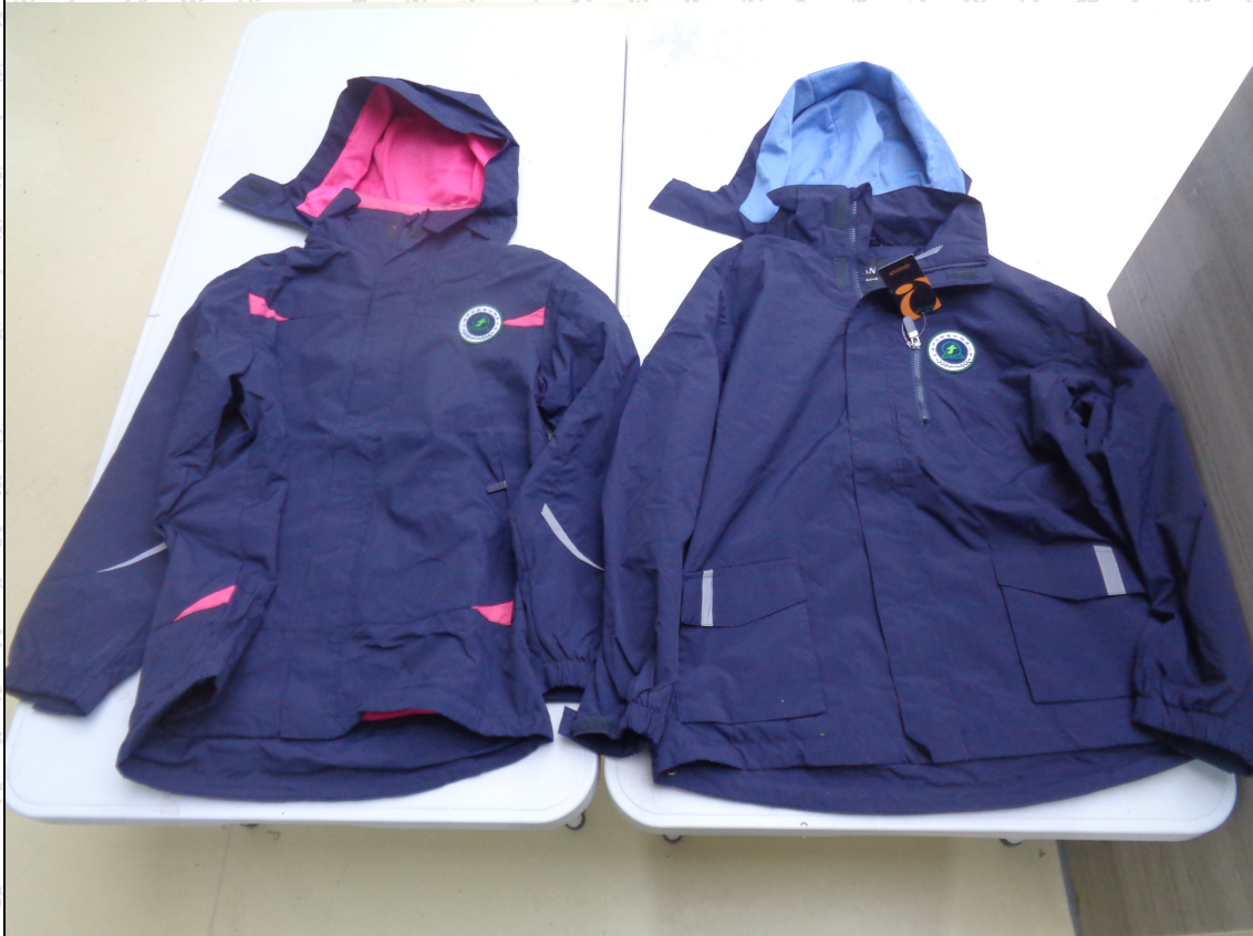
藏青/玫红色外套；藏青/灰蓝色外套